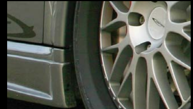
Schwarz Matt eloxiert