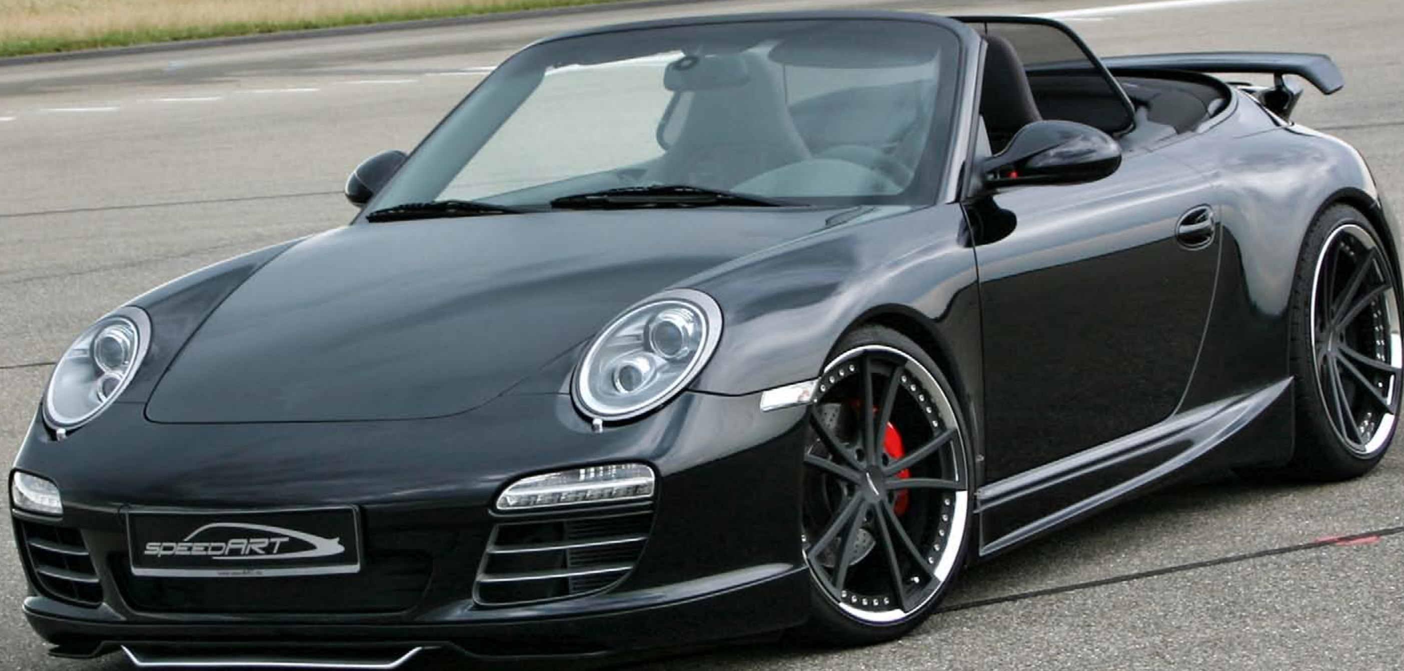
Light Spoke Competition - FORGED 20"