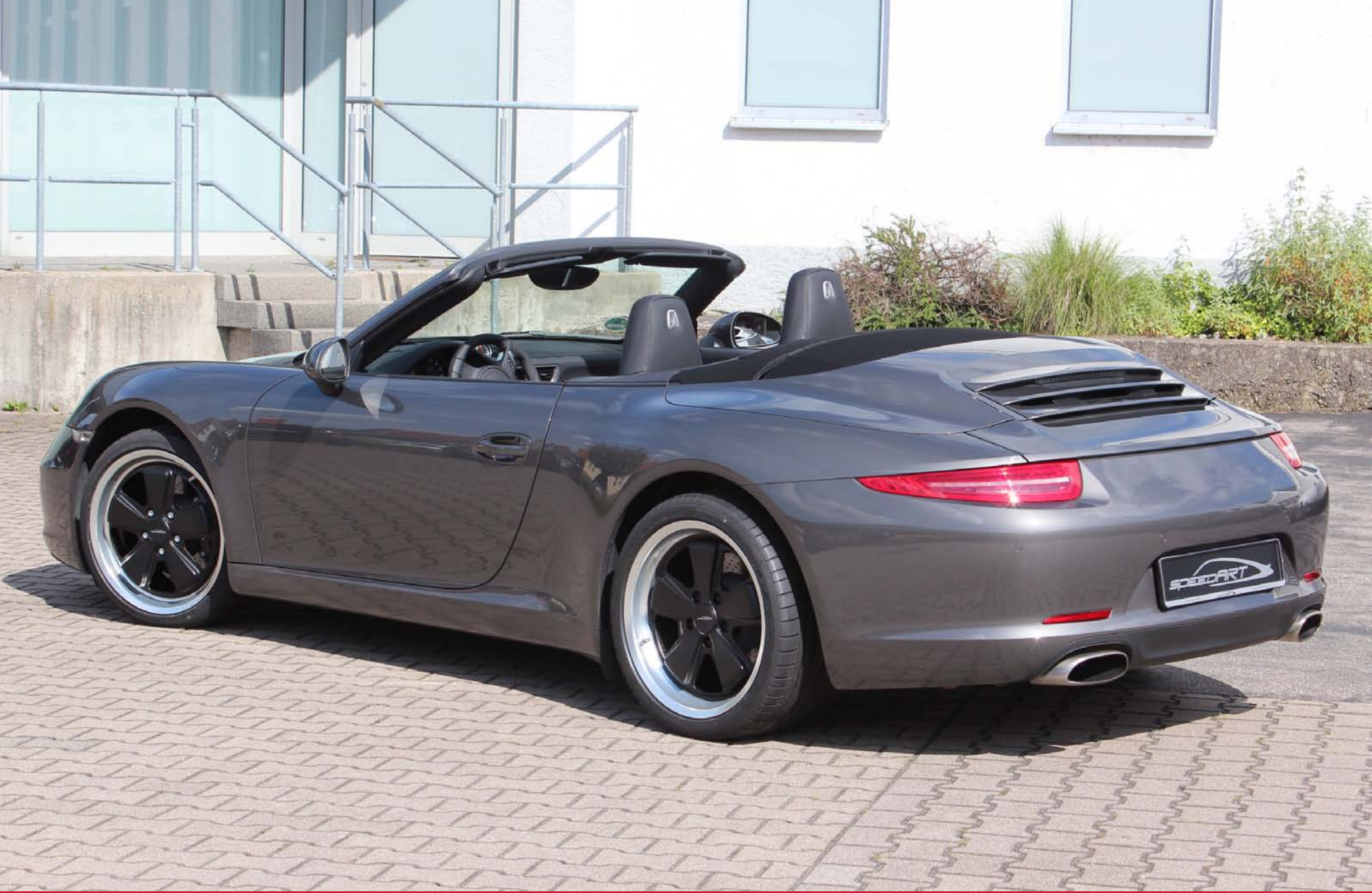
Original Fuchs-Felge 19"